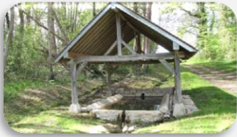
Lavoir de Prin

Les chiens sont des animaux de compagnie appréciés par beaucoup. Pour des raisons de sécurité Il est indispensable de les tenir en laisse lorsqu'ils sont sur le domaine public. Nous rappelons également que les aboiements intempestifs constituent une infraction qui peut être punie de l'amende prévue pour les contraventions de la 3ème classe.