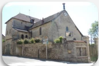
Notre Dame de Serzy et Prin

"Hasard du calendrier paroissial" 18H30 Messe à l'Eglise Notre Dame de Serzy & Prin