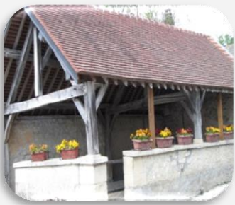
Lavoir de Serzy